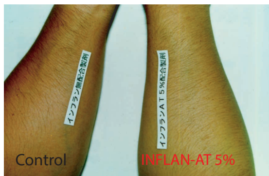
Effect of INFLAN-AT on Anti-Inflammation

This picture demonstrates that, when lotions are applied to the skin after exposure to the sun, the inflammation caused by sunburn is more effectively suppressed by lotion that contains INFLAN-AT than control lotion.